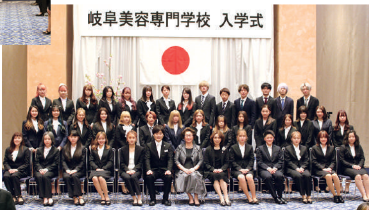
岐阜美容専門学校 入学式

4月5日、ホテルグランヴェール岐阜にて、専門課程22回生の入学式が執り行われました。今年度は計39名が入学、美容の道への第一歩を踏み出しました。